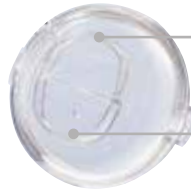
Příhrádka pro přidávání pevných látek Otvor pro přidávání tekutin